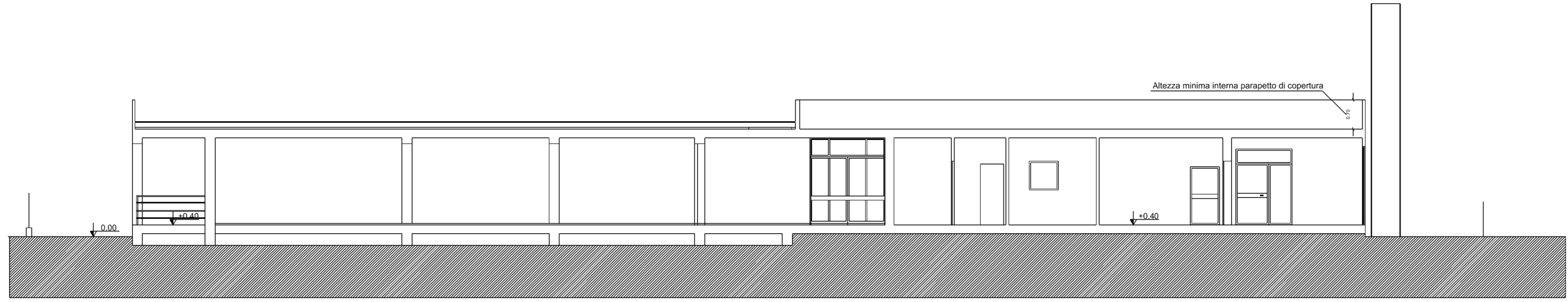
sezione "A - A" - scala 1:100